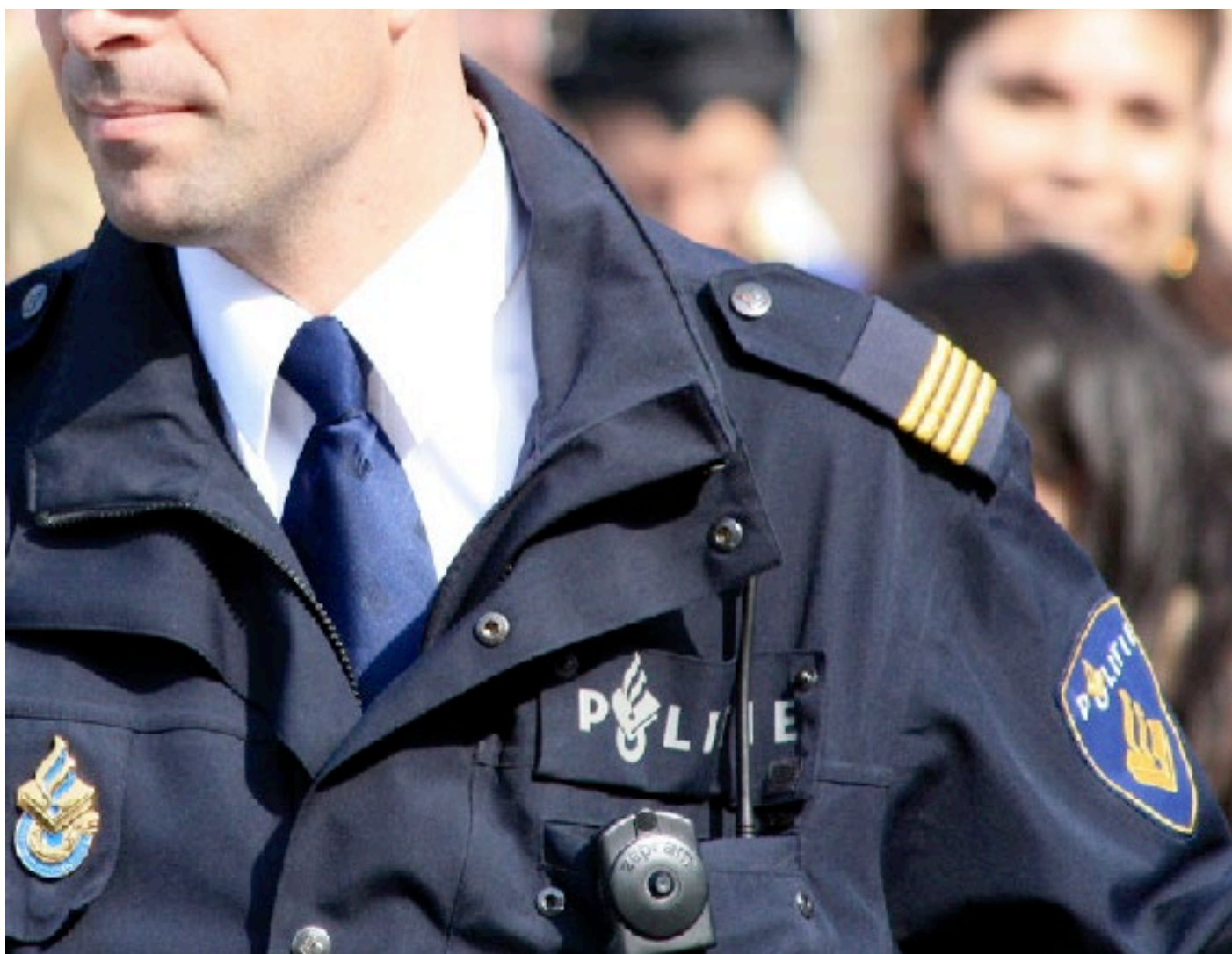
Afbeelding gebaseerd op Untitled van Bas Bogers, uitgebracht onder een Creative Commons BY-NC 2.0 licentie

Uit de onderzoeken blijkt dat de beveiliging van de gegevens bij de politie ondermaats is. Door gebrek aan werkbare systemen slaan veel politieambtenaren gevoelige gegevens op in eigen of gedeelde directories waar controle op toegankelijkheid ont-